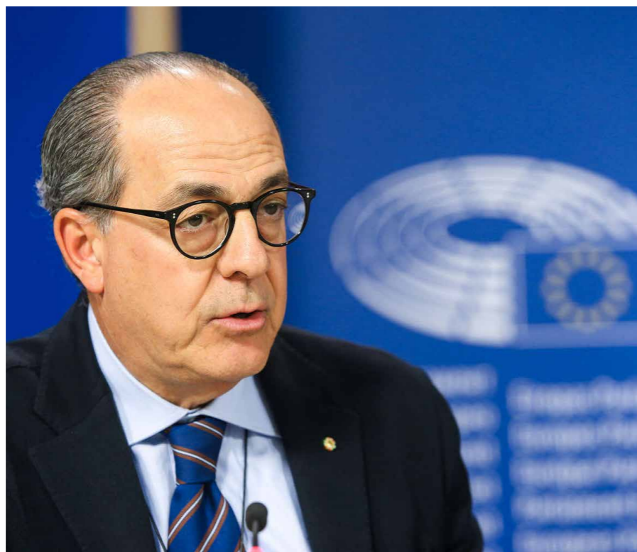
L'euro parlamentare Paolo De Castro, Commissione agricoltura e sviluppo rurale.

vedremo ma ci sono delle condizioni che devono essere applicate: non sono precondizioni, gli aiuti si danno ma se poi si scopre che qualcuno non rispetta le regole gli aiuti dovranno essere tagliati. E questo anche per un principio di corretta competizione tra Paesi che rispettano le regole e Paesi che non le rispettano. Ora ci aspetta la battaglia per la Farm to fork e la biodiversità, occorrerà fare delle analisi di impatto e individuare strumenti alternativi e concreti per gli agricoltori, ad esempio dando seguito allo studio sulla genetica non ogm”.