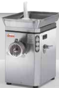
TC NEBRASKA ICE