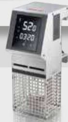
SOFTCOOKER WIFOOD X NFC